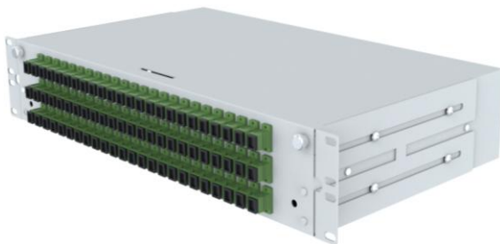
wizualizacja zamkniętej przełącznicy światłowodowej panelowej wysuwanej serii PSW-E