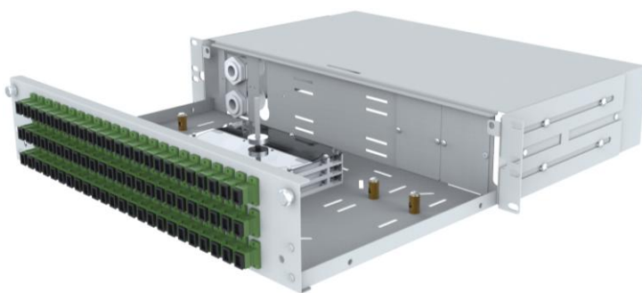
wizualizacja otwartej przełącznicy światłowodowej panelowej wysuwanej serii PSW-E