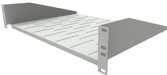
wizualizacja półki rack 2U