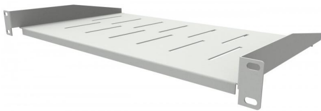
wizualizacja półki rack 1U