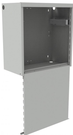
wizualizacja otwartej szafy antywłamaniowej serii SA