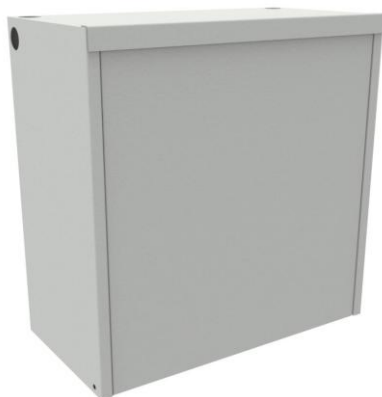
wizualizacja zamkniętej szafy antywłamaniowej serii SA