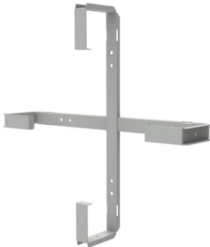
wizualizacja stelaża zapasu kabla SZK