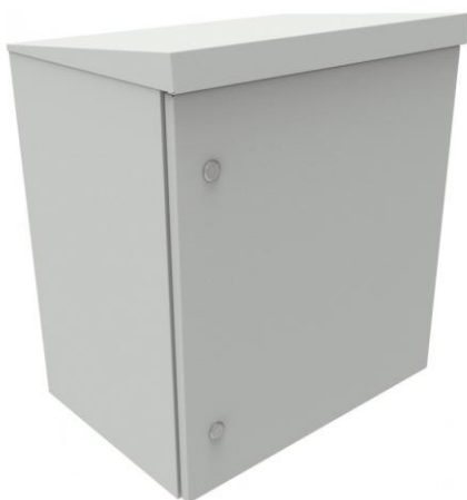
wizualizacja zamkniętej szafy masztowej rack 19" hermetycznej serii SZMH