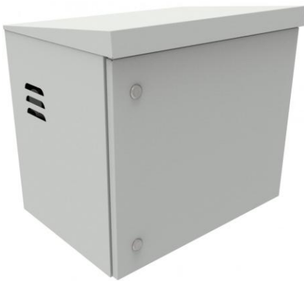
wizualizacja zamkniętej szafy masztowej rack 19" serii SZMH