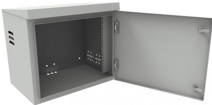
wizualizacja otwartej szafy masztowej rack 19" serii SZMH