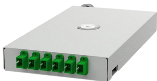
wizualizacja zamkniętej przełącznicy światłowodowej kasetowej serii PK-V2